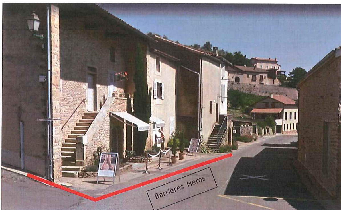
Mise en place de barrières Heras durant l'aménagement extérieur le long de la route de la roche.