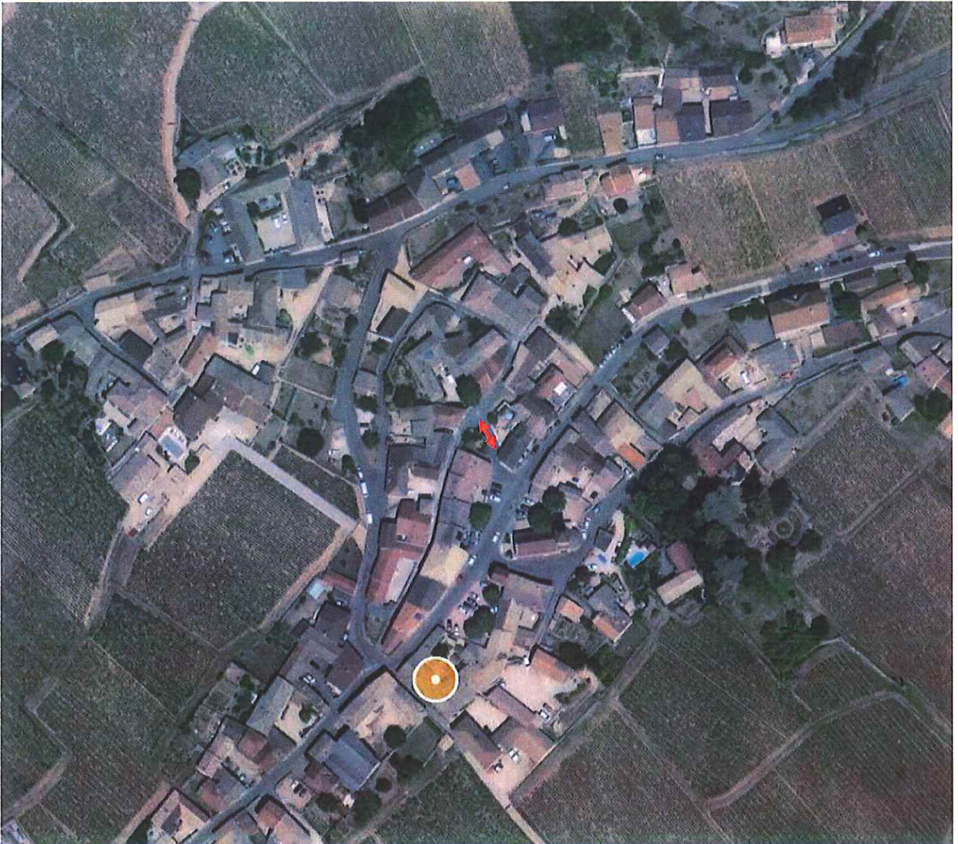
Localisation de la section de rue Edmond Laneyrie barrée à la circulation.