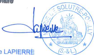
Jean-Claude LAPIERRE Maire

Acte rendu exécutoire réception en Préfecture le 17/10/2019 Publication de notification du 18/10/2019 Signé : Le Maire